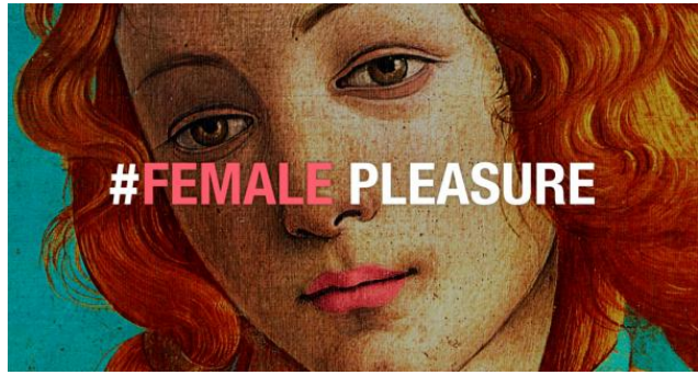
„Die Geburt der Venus“: Bildausschnitt aus #FEMALE PLEASURE